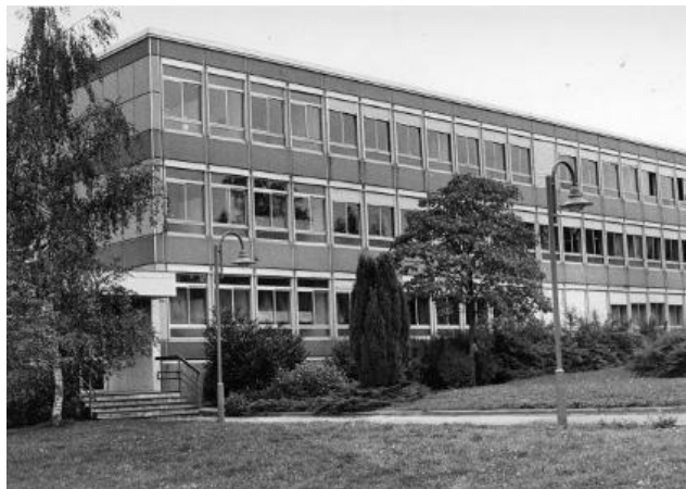
Le lycée en 1994.

En effet, les membres de ce groupe Facebook échangent de bons souvenirs de leur passage au lycée, prennent des nouvelles des copains d'avant et de leurs anciens professeurs ou regrettent l'état de décrépitude dans lequel l'ancien bâtiment de la rue Batty Weber est laissé.