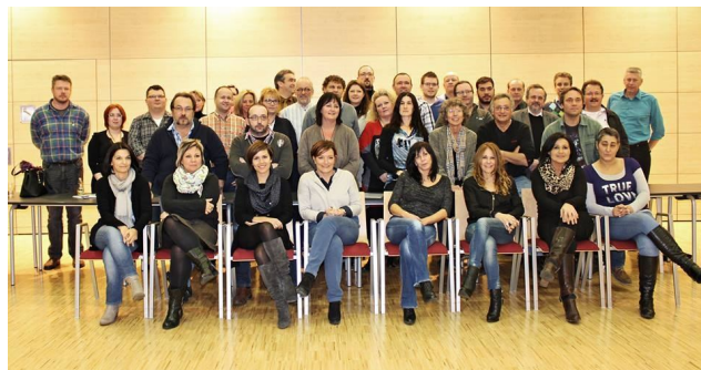
Les membres fondateurs de l'AALtma a.s.b.l.