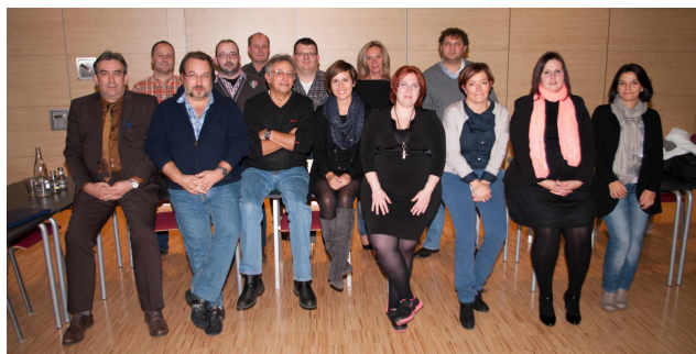
Les membres du premier Conseil d'administration de l'AALtma a.s.b.l.

Créé en juillet 2013, le groupe Facebook AAltma (Anciens et Amis du LTMA) a vite connu un succès fulgurant. Son créateur est passé à l'étape suivante vendredi, en lançant une association d'anciens élèves et professeurs.